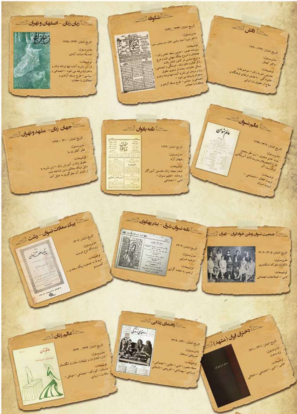
تصاویری از نشریات زنان در دوران مشروطه